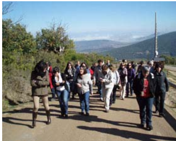
Visita al Aula arqueológica de la Fundación las Médulas.